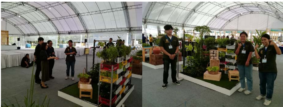
ภาพที่ 5 ผลงานการประกวดสวนผักคนเมือง และมีการตอบคำถามของนักศึกษากับกรรมการ