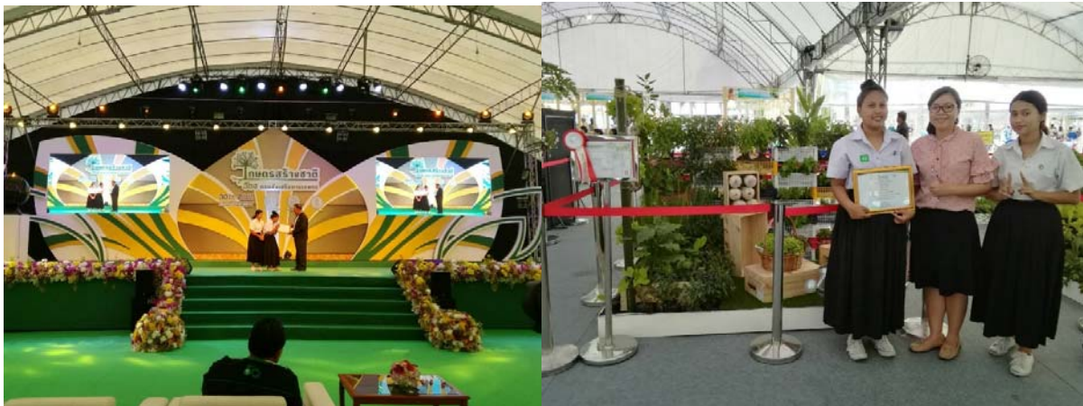
ภาพที่ 4 การประกวดสวนผักคนเมือง ได้รับรางวัลรองชนะเลิศลำดับที่ 2

(2) เพื่อให้ให้นักศึกษาได้ฝึกฝนทักษะในการออกแบบและการปฏิบัติจัดสวนจริง