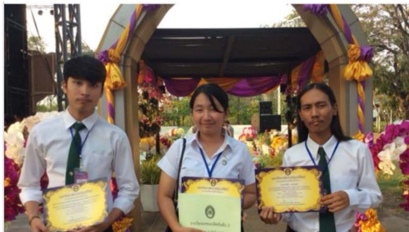
ภาพที่ 3 การจัดสวนหย่อมภายใต้แนวคิด “สวนวัฒนธรรม” ได้รับรางวัลรองชนะเลิศลำดับที่ 2