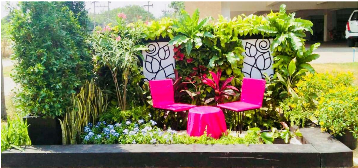
ภาพที่ 2 ผลงานการจัดสวนหย่อมภายใต้แนวคิด “สวนวัฒนธรรม”