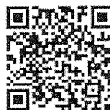
QR Code ลงทะเบียน