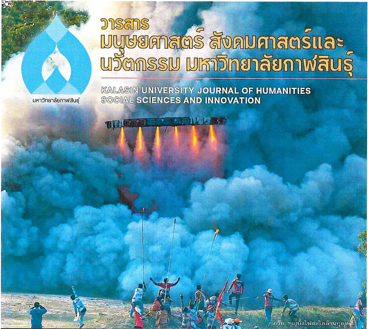
ภาพ: บุญนั่งไฟตะไลล้านคู่คุดหมี่

KALASIN UNIVERSITY JOURNAL OF HUMANITIES SOCIAL SCIENCES AND INNOVATION