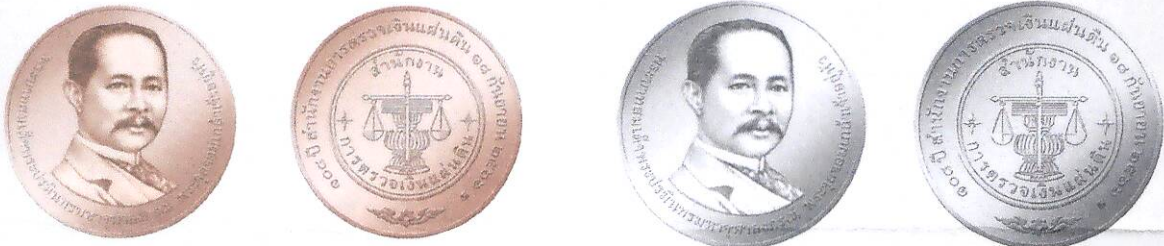
ชนิดเหรียญทองแดง ประเภทธรรมดา ขนาดเส้นผ่านศูนย์กลาง 30 มิลลิเมตร