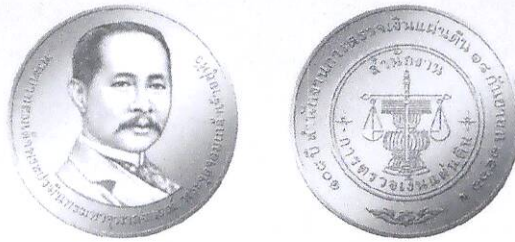
ชนิดเหรียญเงิน ประเภทธรรมดา ขนาดเส้นผ่านศูนย์กลาง 30 มิลลิเมตร